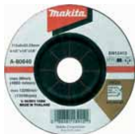
A-80640 Brúsny kotúč na ocel a nehrdzavejúcu ocel 115 x 6 x 22