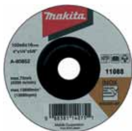
A-80852 Brúsny kotúč na ocel a nehrdzavejúcu ocel 100 x 6 x 16