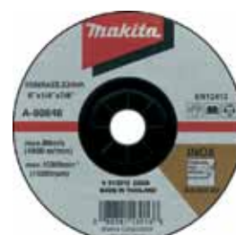
A-80846 Brúsny kotúč na ocel a nehrdzavejúcu ocel 150 x 6 x 22