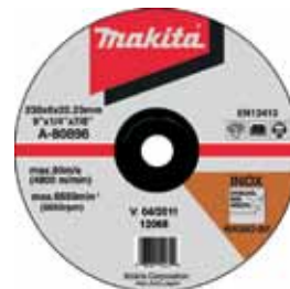
A-80896 Brúsny kotúč na ocel a nehrdzavejúcu ocel 230 x 6 x 22