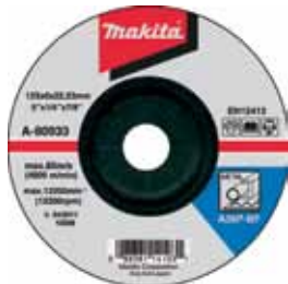
A-80933 Brúsny kotúč na kov 125 x 6 x 22