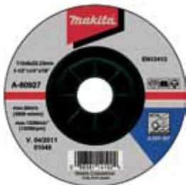
A-80927 Brúsny kotúč na kov 115 x 6 x 22