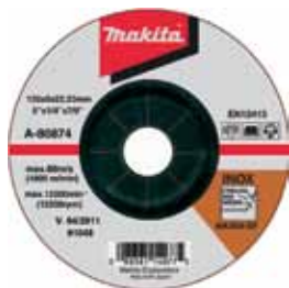
A-80874 Brúsny kotúč na ocel a nehrdzavejúcu ocel 125 x 6 x 22