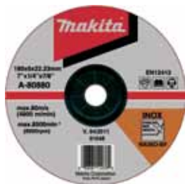
A-80880 Brúsny kotúč na ocel a nehrdzavejúcu ocel 180 x 6 x 22