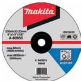
A-80955 Brúsny kotúč na kov 230 x 6 x 22