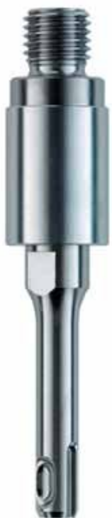
Vŕtacie korunky UNICUT