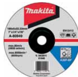
A-80949 Brúsny kotúč na kov 180 x 6 x 22