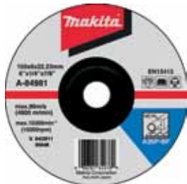
A-84981 Brúsny kotúč na kov 150 x 6 x 22